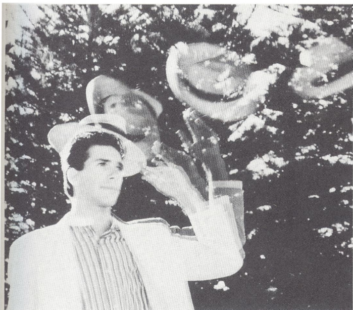
Multieksponering i serieindstilling med flash.

Z-up 80 – den mest avancerede »snap-shotter« til dato – er netop blevet præsenteret på det danske marked af Konica Foto Danmark A/S.